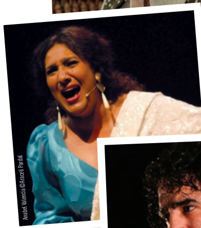
Anabel Valencia © Anabel Perdigón