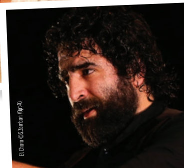
El Choro