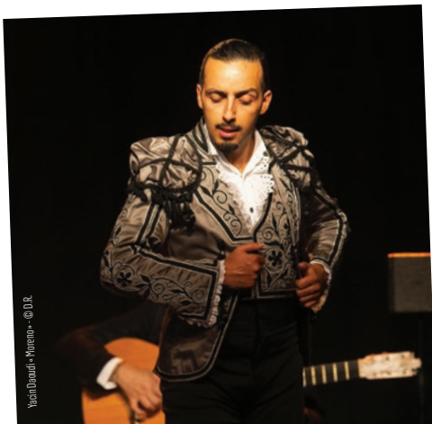
Yacine Daoudi - Moreno

Les artistes programmés pendant le festival