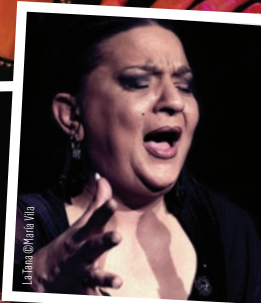
La Tana © Marie Viala