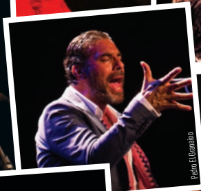
Peon El Granadino